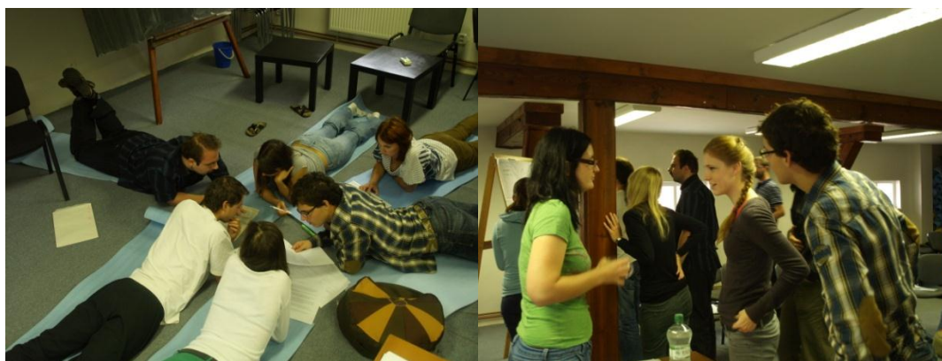
i tak může vypadat řešení právního problému

Většina výuky poskytla velký prostor na debatu a diskusi studentů, kteří se před příjezdem připravovali z rozeslaných studijních podkladů. Co se při práci ve výuce probíralo, bylo do jisté míry závislé na projeveném zájmu a tématech, která studenti otevřeli – co si z výuky odnesli a vytěžili, záviselo jen na jejich aktivní participaci. Stejně tomu bylo při besedách s hosty i při večerních neformálních setkáních s organizátory.